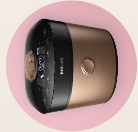
飛利浦智慧萬用鍋 1臺