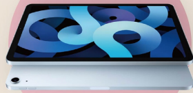
Apple iPad Air 1臺