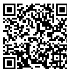
親子綁定操作 步驟說明